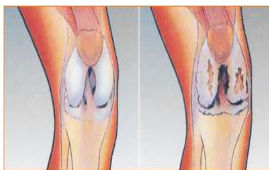
Gambar 1. Sendi lutut normal dan sendi lutut dengan osteoarthritis

degradasi rawan sendi, remodeling tulang, dan inflamasi cairan sendi. Tulang rawan sendi sebenarnya dapat melakukan perbaikan sendiri dimana khondrosit akan mengalami replikasi dan memproduksi matriks baru. Proses perbaikan ini dipengaruhi oleh faktor pertumbuhan suatu polipeptida yang mengontrol proliferasi sel dan membantu komunikasi antar sel. Peningkatan degradasi kolagen akan mengubah keseimbangan metabolisme rawan sendi. Kelebihan produk hasil degradasi matriks rawan sendi ini cenderung berakumulasi di sendi dan menghambat fungsi rawan sendi serta mengawali suatu respons imun yang menyebabkan inflamasi sendi.